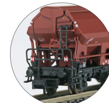
Seitentladewagen mit Zugschluss Scheiben